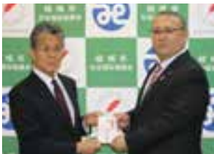
京三電機株式会社様