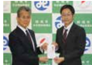
京三電機労働組合様