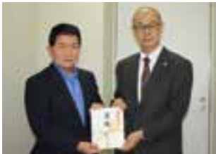
演友会&素敵仲間たち 第27回カラオケ発表会様