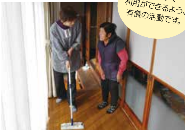
有償在宅福祉サービス事業支援時の様子