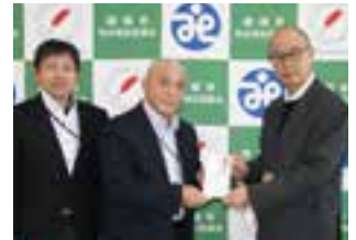
レゾナック労働組合下館支部様