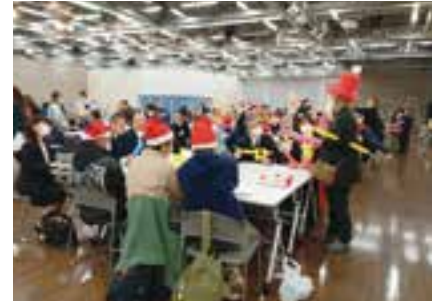
③第29回障害者週間クリスマス会 の様子(12月2日開催)