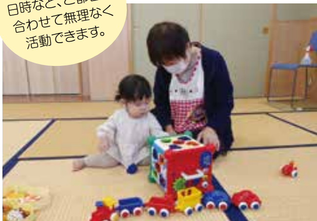
ファミリーサポートセンター事業支援時の様子