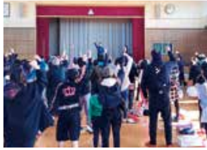
②ゆうゆうカーニバルの様子 (11月18日開催)