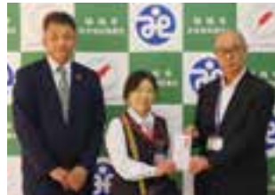
古河ヤクルト販売株式会社様