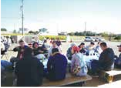
①結城市障害者福祉センター 交流会の様子(10月22日開催)