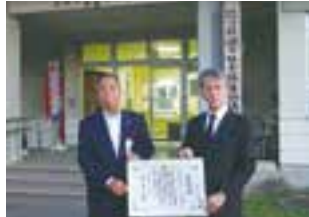
結城災害救援ボランティア連絡会様

令和5年10月26日ザ・ヒロサワ・シティ会館におい て開催されました。結城市から下記の皆様が茨城県知 事表彰並びに茨城県社会福祉協議会会長表彰を受けま した。おめでとうございます。